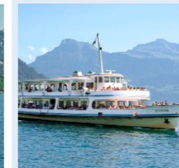
EUROPA 278 Bankettplätze