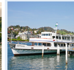
GOTTHARD 280 Bankettplätze