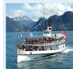
GALLIA 104 Bankettplätze