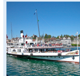
STADT LUZERN 269 Bankettplätze