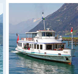
TITLIS 122 Bankettplätze