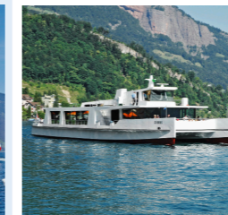
KATAMARAN CIRRUS 120 Bankettplätze