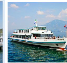
BRUNNEN 172 Bankettplätze