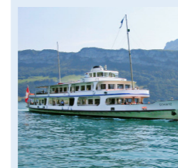
SCHWYZ 188 Bankettplätze