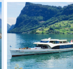
PANORAMA-YACHT SAPHIR 80 Bankettplätze