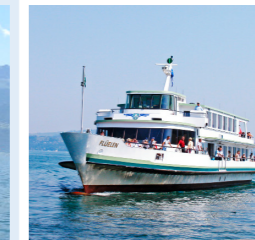
FLÜELEN 172 Bankettplätze