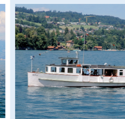
RÜTLI 36 Sitzplätze

Die Anzahl Bankettplätze gibt Ihnen einen Anhaltspunkt über die maximale Personenzahl bei einem Bankett. Natürlich können Sie auch mit weniger Personen ein gewünschtes Schiff mieten.