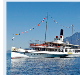
UNTERWALDEN 182 Bankettplätze