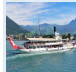
SCHILLER 114 Bankettplätze