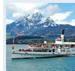
GALLIA 104 Bankettplätze