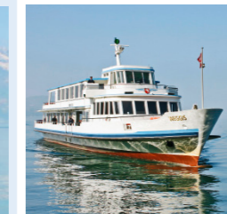
WEGGIS 170 Bankettplätze