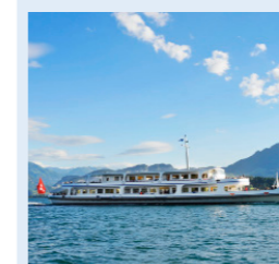
WINKELRIED 172 Bankettplätze