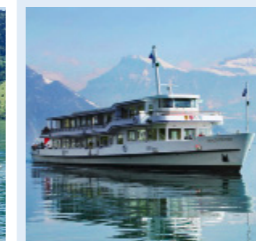
WALDSTÄTTER 286 Bankettplätze